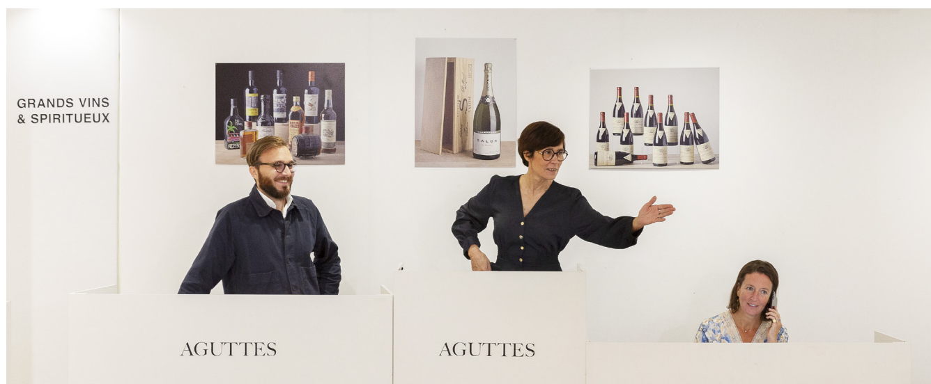
Vente Grands vins & Spiritueux en septembre 2025