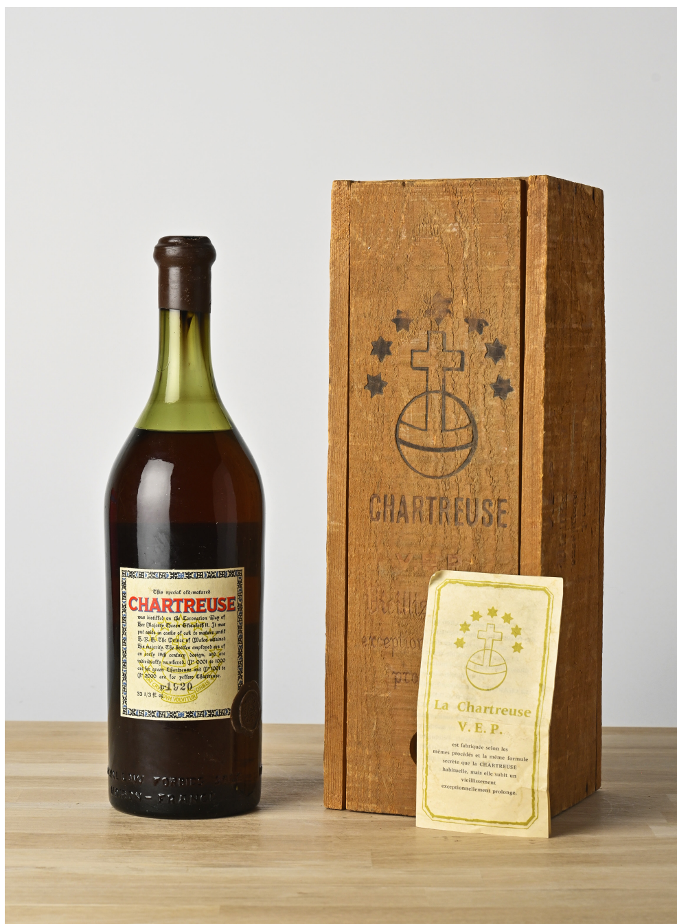
Chartreuse jaune V.E.P. « Couronnement de la Reine Elisabeth II » 1953, Pères Chartreux Vendue 12 500 €

Contact : Pierre-Luc Nourry + 33 1 47 45 91 50 • nourry@aguttes.com